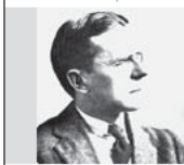
Leslie Patrick ABERCROMBIE (Auton-Upon-Mersay, Cheshire-Inglaterra, 1879-Aston Timold, Berkshire-Inglaterra, 1957)