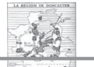
Ordenación de ciudades (p. 21 de la 194)

La presentación del libro concluye con un apartado que trata de identificar su aportación a la disciplina urbanística