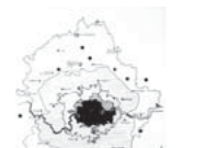
Plan de desarrollo para el área alrededor de la 100

En los libros escritos en otros idiomas, aquí se indica la referencia bibliográfica de la edición en español; y si no existe, la traducción del título original, enmarcada entre corchetes